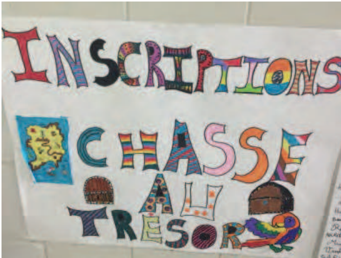
Grande chasse au trésor pour favoriser l'entraide et la cohésion de groupe.