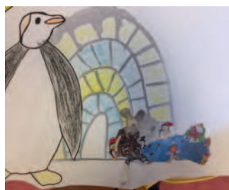
Activités manuelles et créatives avec Souricette, la mascotte de l'accueil, qui a voyagé autour du monde.